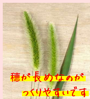
穂が長めなのが つくりやすいです