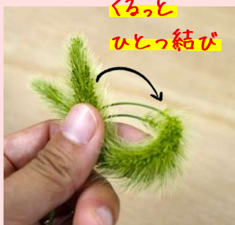
くるっと ひとつ結び