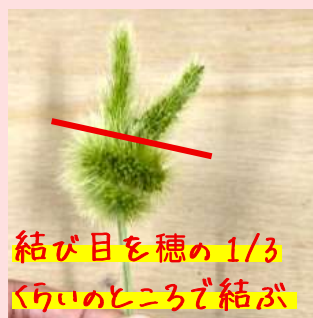
結び目を穂の1/3 くらいのところで結ぶ