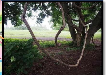
ブランコの木、これも藤です