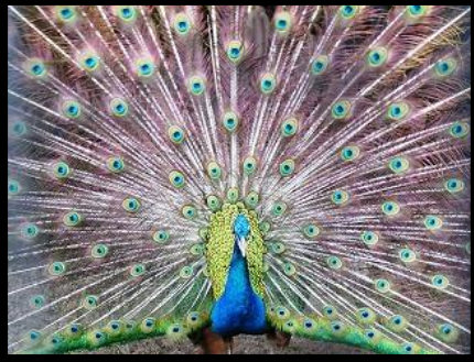
今年5月27日に孔雀がお目見えしました