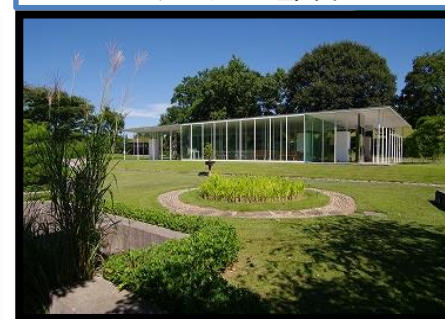
ジェラテリアと雪華園