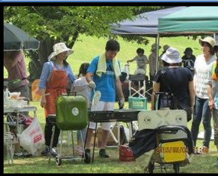
中山台や芝生広場でバーベキュー