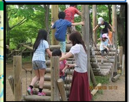
遊具広場も楽しいよ