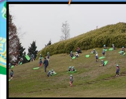
芝滑りが楽しい、富士見塚