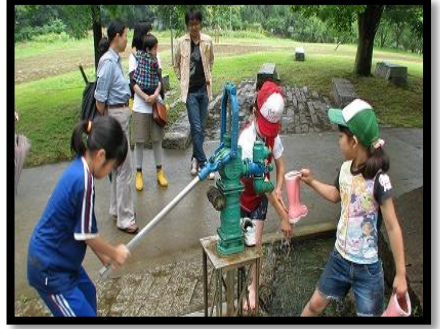
みんなに人気のガッチャンポン