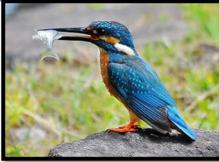
水辺の宝石といわれる、カワセミです