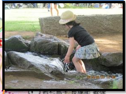
ちょっと冷たくて気持ちいい、せせらぎ