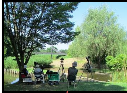
撮影場所、ここでじっと待ってます