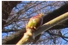
ニワトコの葉芽(左)と花芽(右) 葉芽は細長く、花芽は丸く膨らんでいます。

来年度も年4回の開催を予定しています。 (決定次第お知らせいたします) 皆様のご参加をお待ちしています！