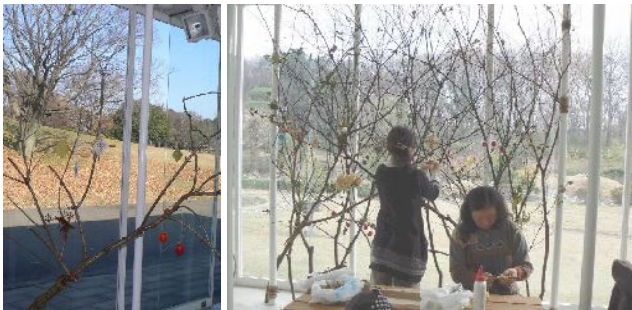
クリスマスインテリア作成中 (写真左:入口付近、右:雪華園を背景に) もりもりクラブが木を準備、どろんこクラブ (12/13) で飾り付け、トータルコーディネートはジェラテリア応援団。