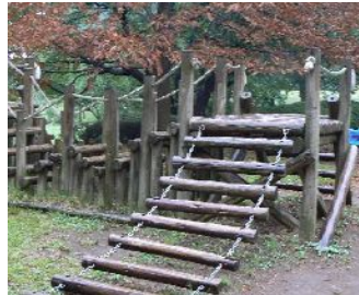
この冬に、老朽化した滑り台(左)と渡り丸太(右)を撤去し、コンビネーション遊具(1基)を新設する予定です。